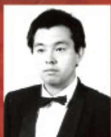
覚義 太田 賢治 テノール